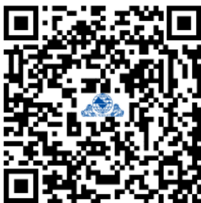
第五届岩土工程国产软件发展论坛

请参会人员于 2025 年 11 月 15 日前扫描下方二维码报名，务必按时报到参加会议。