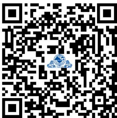
第五届岩土工程国产软件发展论坛

请参会人员于 2025 年 11 月 15 日前扫描下方二维码报名，务必按时报到参加会议。